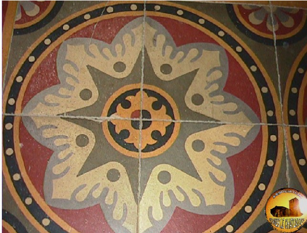
Détail du carrelage de la tour Magdala

Depuis longtemps, des chercheurs perspicaces ont découvert des particularités dans les carrelages de la tour Magdala et de son pendant de verre. En effet, à certains endroits du sol, un carreau se distingue des autres par le fait qu'il montre un point de couleur différente dans le motif général dont il fait partie. Pour la tour Magdala, celui-ci se situe devant le départ de l'escalier menant à la terrasse. À l'Orangerie, le carreau se situait, car il fut enlevé il y a quelques années lors de travaux de réfection du sol, dès l'entrée.