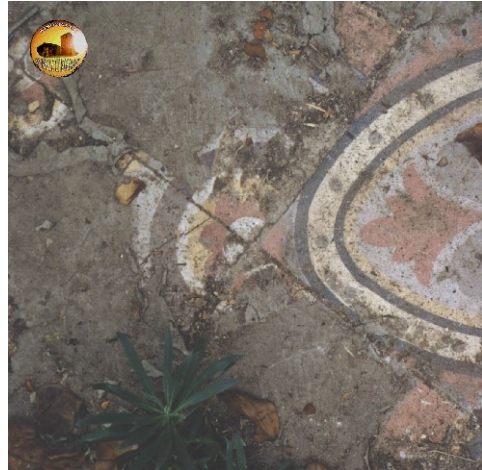
Détail du carrelage de l'Orangerie

À l'origine, le carrelage dans la serre devait se présenter ainsi :